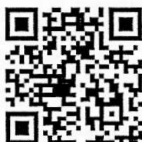
คำร้องขอโอน