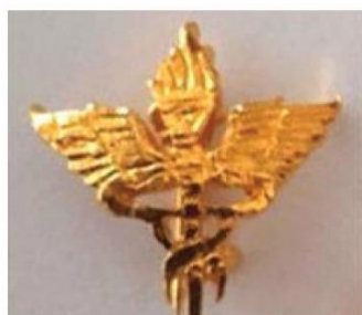
เครื่องหมายแสดงสังกัด กระทรวงสาธารณสุข รูปคณเพ็ลิ่งมีปีกและมิงูพันคณเพ็ลิ่ง