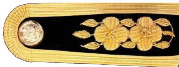
ข้าราชการประเภททั่วไป ระดับปฏิบัติงาน บำช้อชัยพฤกษ์ มีดอก 2 ดอก