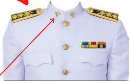
เครื่องหมาย แสดงสังกัด