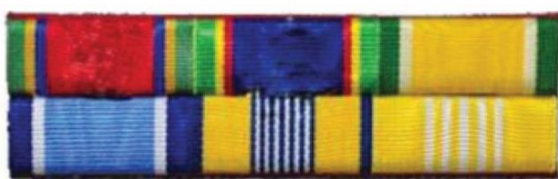
(ตัวอย่างแพรแถบย่อเหรียญที่ระลึก)

สำหรับข้าราชการบรรจุใหม่ ระดับได้เฉพาะ แพรแถบย่อเหรียญที่ระลึก ไม่สามารถประดับ แพรแถบย่อเครื่องราชอิสริยาภรณ์ ได้ จนกว่าจะได้รับพระราชทานเครื่องราชในชั้นนั้นๆ