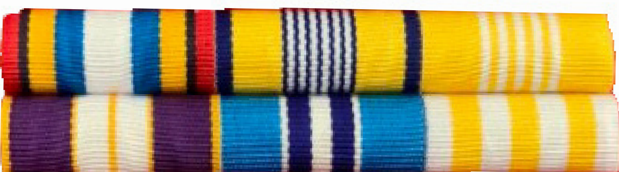
(ตัวอย่างแพรแถบย่อเหรียญที่ระลึก)

สำหรับข้าราชการบรรจุใหม่ ระดับได้เฉพาะ แพรแถบย่อเหรียญที่ระลึก ไม่สามารถประดับ แพรแถบย่อเครื่องราชอิสริยาภรณ์ ได้ จนกว่าจะได้รับพระราชทานเครื่องราชในชั้นนั้นๆ