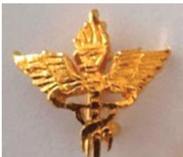
เครื่องหมายแสดงสังกัด กระทรวงสาธารณสุข รูปคบเพลิงมีปีกและมิงูพันคบเพลิง