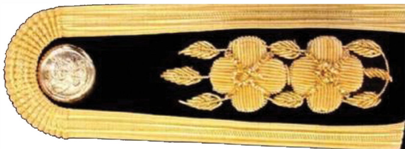
ข้าราชการประเภททั่วไป ระดับปฏิบัติงาน บำช้อชัยพฤกษ์ มีดอก 2 ดอก