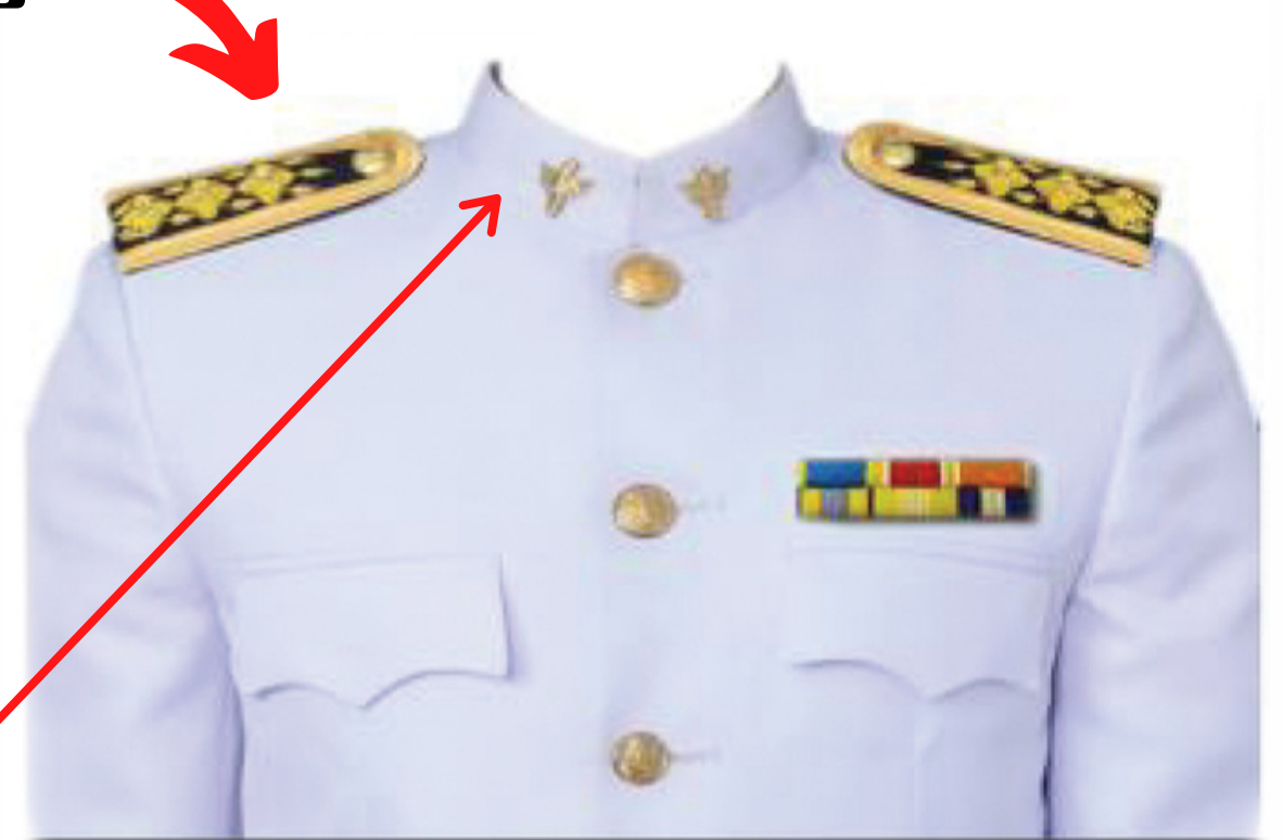
เครื่องหมาย แสดงสังกัด