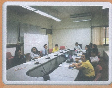
กิจกรรมแลกเปลี่ยนเรียนรู้ (KM) ณ ห้องประชุมกองการเจ้าหน้าที่ อาคาร ๒ ชั้น ๒ วันที่ ๑๕ มกราคม ๒๕๖๑